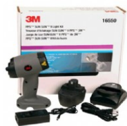
+ ver produto Ref. Nº 16550 3M Sun Gun II